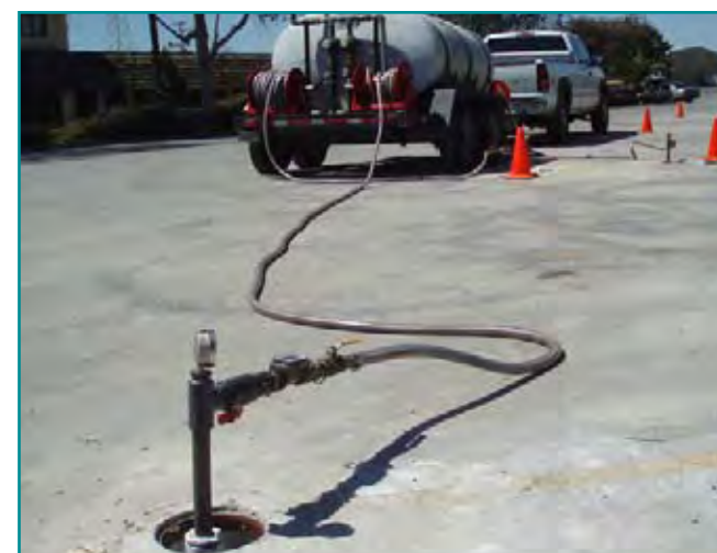
Inyección de suero de queso y melaza en Romic

La Alternativa 3 incluye el tratamiento biológico aumentado como la tecnología remediadora primaria. El tratamiento biológico aumentado es una tecnología que puede contener con eficacia la contaminación en el sitio y también remediación de áreas de fuente de contaminación. Se espera que la Alternativa 3 cueste 2.5 millones de dólares.