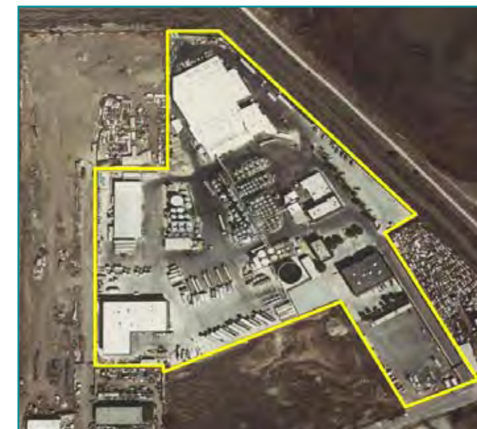
Fotografía aérea de Romic en 1997

La Alternativa 2 también como la Alternativa 3 incluyen la investigación de agua subterránea y de los suelos, la excavación y el retiro de los suelos contaminados en algunas áreas de fuente, monitoreo y reportaje de la evaluación de la eficacia del remedio, aseguramiento financiero, y restricciones de uso de terreno.