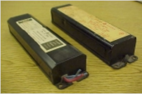
Estabilizadores de las Bombillas Fluorescentes

Los desperdicios con PCBs procesados principalmente por LRI son los estabilizadores de las bombillas fluorescentes, enseñados arriba. Los estabilizadores son separados en metal chatarra y