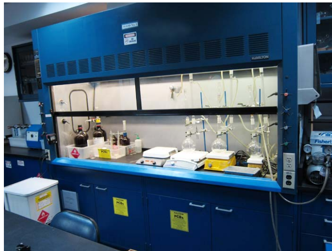
Laboratorio de Clean Harbors

En base a una revisión de todos los documentos del Registro Administrativo, incluidos los registros de inspección, la EPA ha determinado que el funcionamiento de esta instalación de almacenamiento de PCB no presenta un riesgo irrazonable para la salud humana o el medio ambiente. El Registro Administrativo contiene, entre otros documentos, la Solicitud