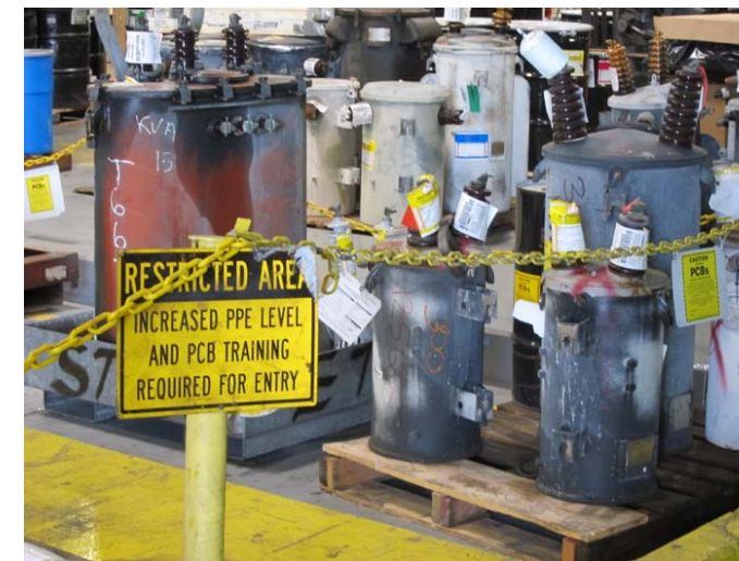
Equipo con PCBs en almacenamiento.

La EPA tomará una decisión final respecto a renovar, bajo la ley TSCA, la aprobación de Clean Harbors después de considerar todos los comentarios del público que se presenten durante el periodo de comentarios de 45 días. Las preguntas y comentarios acerca de la aprobación o el proceso de aprobación se pueden dirigir al gerente de proyectos de la EPA en cualquier