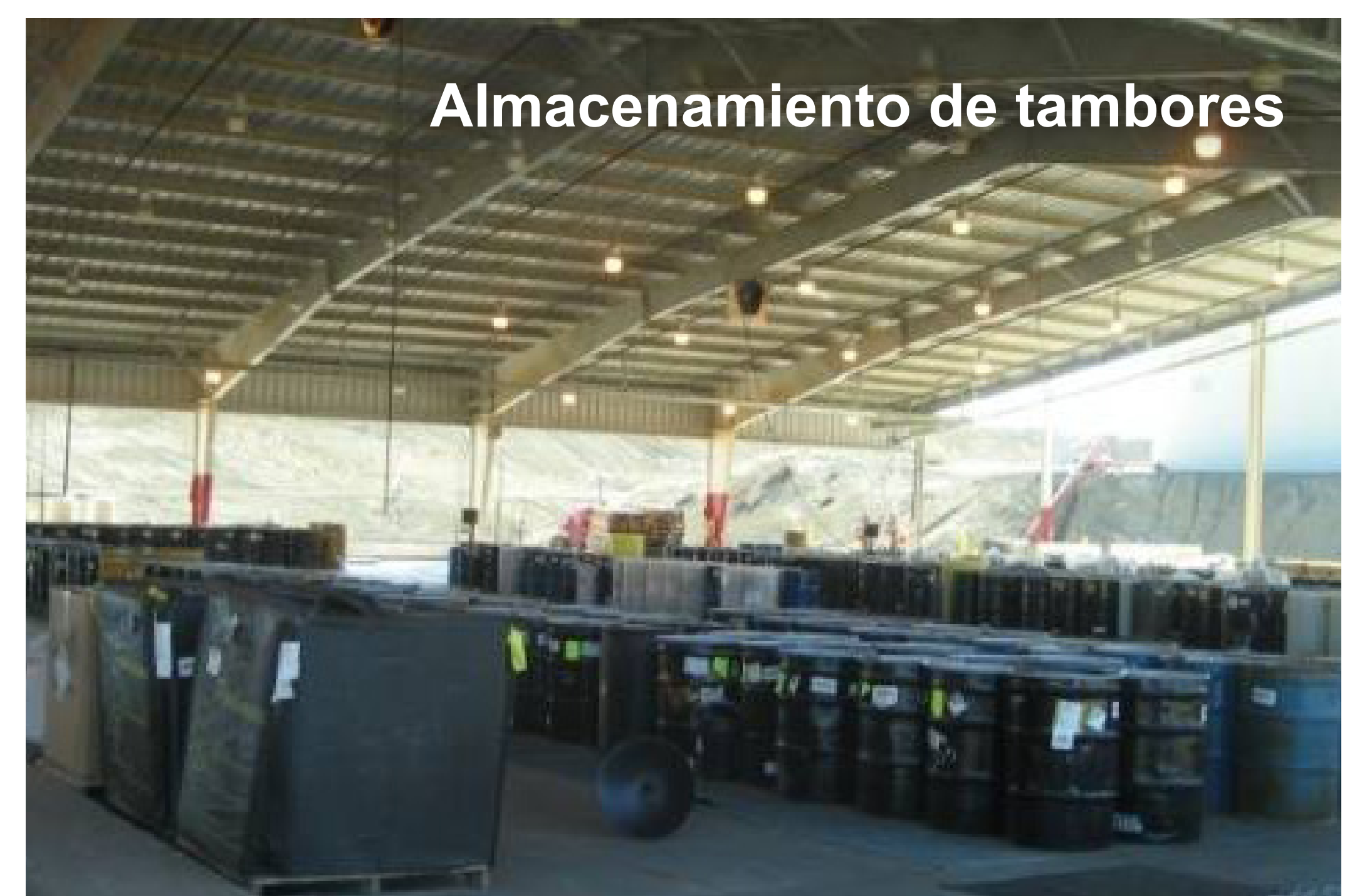
Almacenamiento de tambores