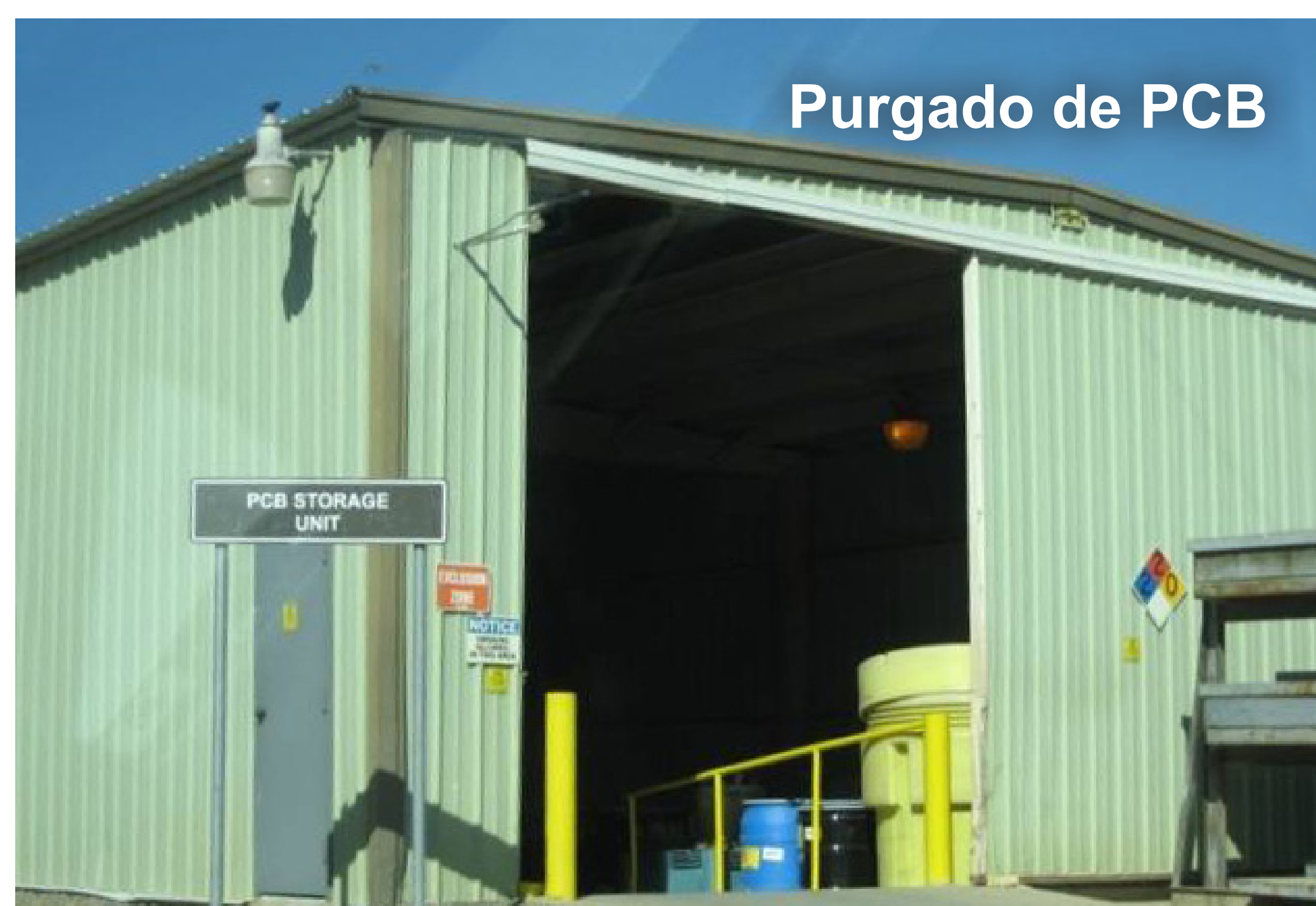
Purgado de PCB