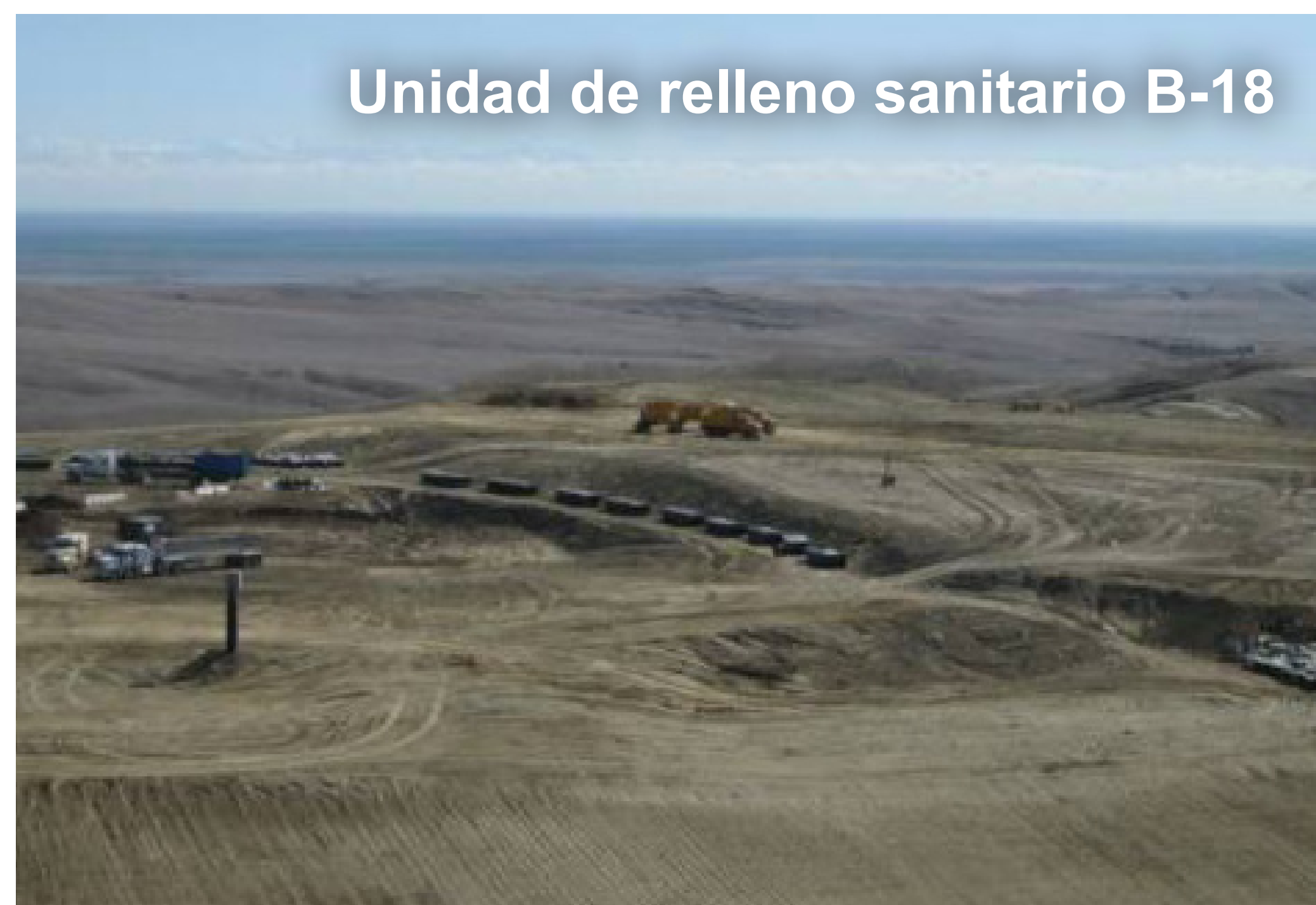
Unidad de relleno sanitario B-18