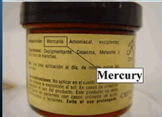
Samples of Crema Aguamary face cream, left, and eye cream