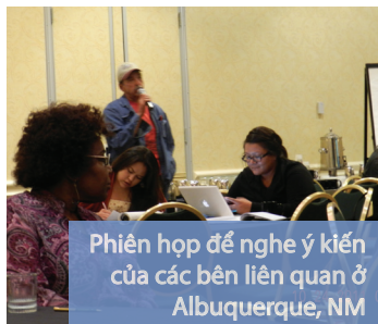
Phiên họp để nghe ý kiến của các bên liên quan ở Albuquerque, NM