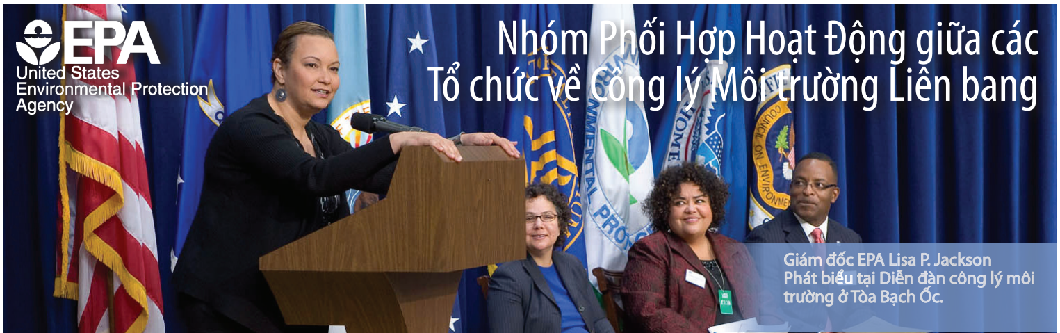
Giám đốc EPA Lisa P. Jackson Phát biểu tại Diễn đàn công lý môi trường ở Tòa Bạch Ốc.