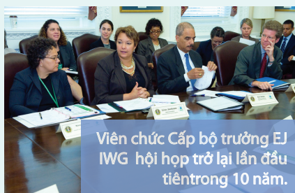
Viên chức Cấp bộ trưởng EJ IWG hội họp trở lại lần đầu tiên trong 10 năm.

Diễn đàn làm hồi sinh lại hoạt động môi trường liên bang theo chương trình EO 12898 ở cấp Quản lý và dẫn đến việc trao đổi thông tin hiệu quả giữa các cơ quan liên bang và các nhà vận động công lý môi trường bên ngoài.