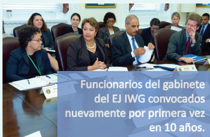
Funcionarios del gabinete del EJ IWG convocados nuevamente por primera vez en 10 años.

El foro revitalizó la acción de la justicia ambiental federal bajo el Decreto 12898 a nivel del gobierno y dio lugar a un exitoso intercambio de información entre las agencias federales y los defensores externos de la justicia ambiental.