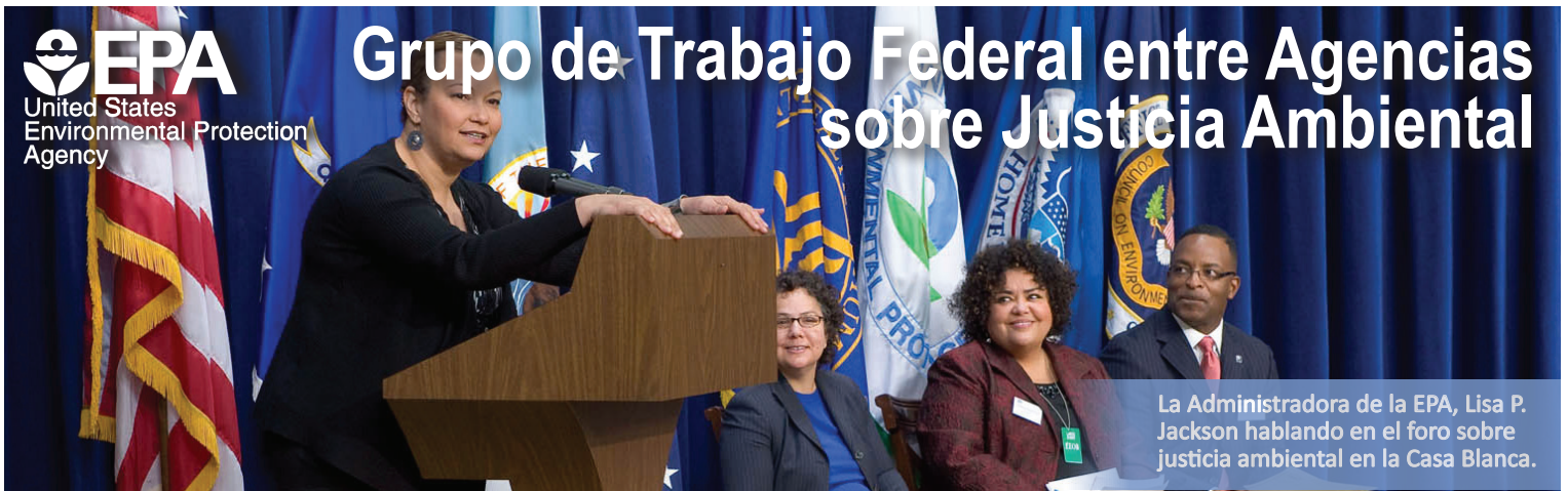
La Administradora de la EPA, Lisa P. Jackson hablando en el foro sobre justicia ambiental en la Casa Blanca.