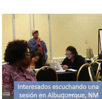
Interesados escuchando una sesión en Albuquerque, NM