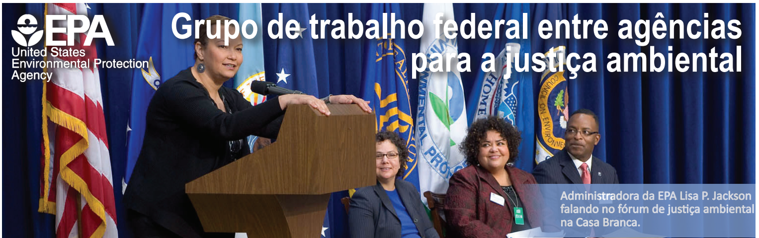
Administradora da EPA Lisa P. Jackson falando no fórum de justiça ambiental na Casa Branca.