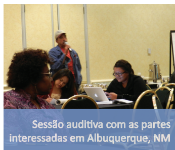
Sessão auditiva com as partes interessadas em Albuquerque, NM

▶ Promover a manutenção de comunidades saudáveis e sustentáveis. A EPA, em conjunto com outras agências federais, coordena ações das agências para melhorar a saúde e sustentabilidade em comunidades sobrecarregadas, incluindo o monitoramento da adaptação climática e o transporte de mercadorias. Por exemplo, a Sustainable Communities Partnership (Parceria por comunidades sustentáveis), uma parceria entre o Departamento de moradia e desenvolvimento urbano, o Departamento de transportes e a EPA, aprimora o acesso a moradia com preço acessível, opções de transporte e custos menores de transporte, enquanto protege o ambiente em comunidades de todo o país.