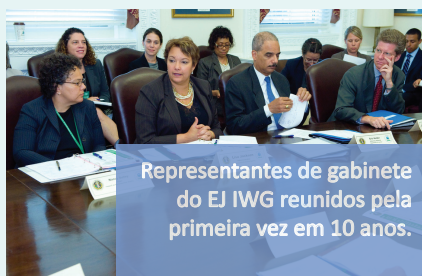
Representantes de gabinete do EJ IWG reunidos pela primeira vez em 10 anos.

O fórum revigorou ações federais de justiça ambiental sob a EO 12898 no nível da administração e levou a uma bem-sucedida troca de informações entre agências federais e defensores externos da justiça ambiental.