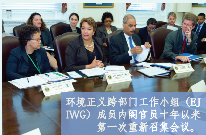
环境正义跨部门工作小组 (EJ IWG) 成员内阁官员十年以来第一次重新召集会议。

论坛重新启动了根据12898号执行令在行政层的联邦环境正义行动，并且让联邦机构与外部环境正义支持者之间进行了成功交流。