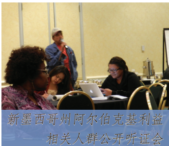
新墨西哥州阿尔伯克基利益相关人群公开听证会