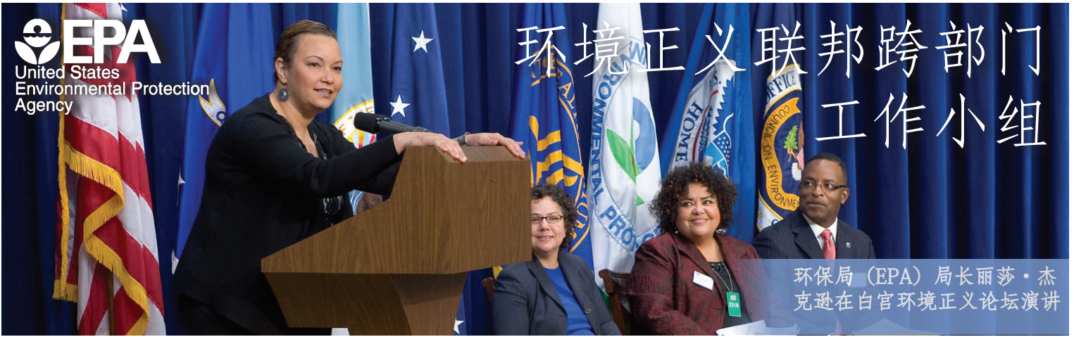
环保局 (EPA) 局长丽莎·杰克逊在白宫环境正义论坛演讲